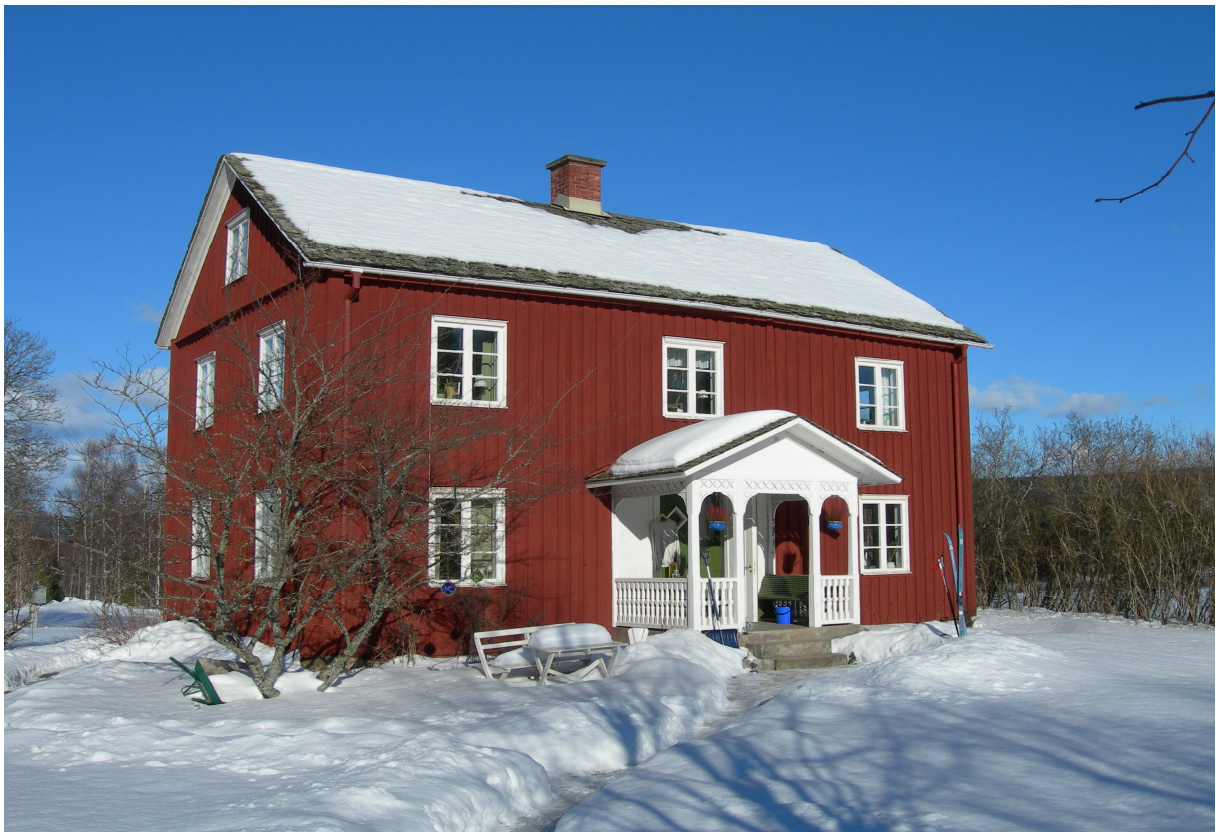
Regional byggnadskultur kan vara en del av den värmländska kulturencyklopedin. Här en god representant för 1800-talets byggnadsskick på den värmländska landsbygden.

Utan att diskutera vad som är rätt och riktigt i fråga om kultur kan det konstateras att det i likhet med det mesta som har med människor att göra handlar om något som är i rörelse och förändring . Att värmländsk kultur verkligen skulle vara något blir därför på sätt och vis en främmande tanke (hur gärna vi än skulle vilja att Frödings och Lagerlöfs berättelser skulle kunna ge innehåll och mening även i en oviss framtid). Med och motkrafter, kulturkonservativa strömningar och kulturradikala strömningar sida vid sida är verkligheten om kultur skall ägnas intresse. Ett sådant synsätt kan tas för intäkt att såväl de klassiska och väletablerade författarna, konstnärerna och skådespelarna som de nya framväxande ges utrymme. Emellertid kan det finnas skäl att diskutera avgränsningen i tid både bakåt och framåt.